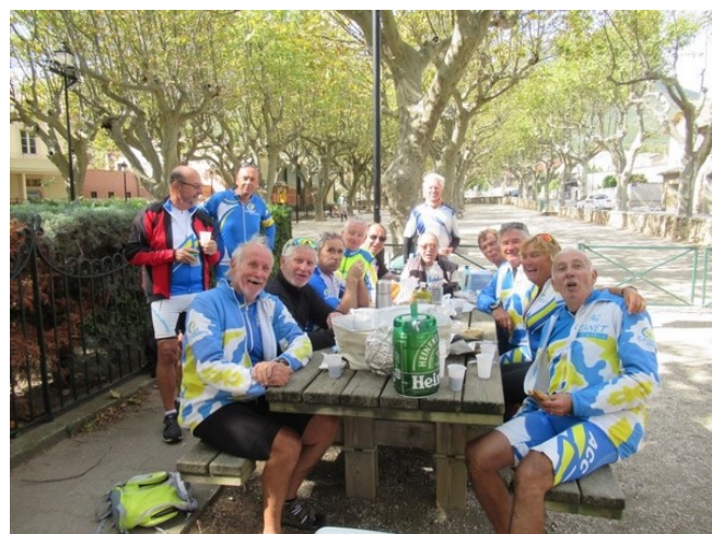
Retour dans les Corbières au départ de Tuchan