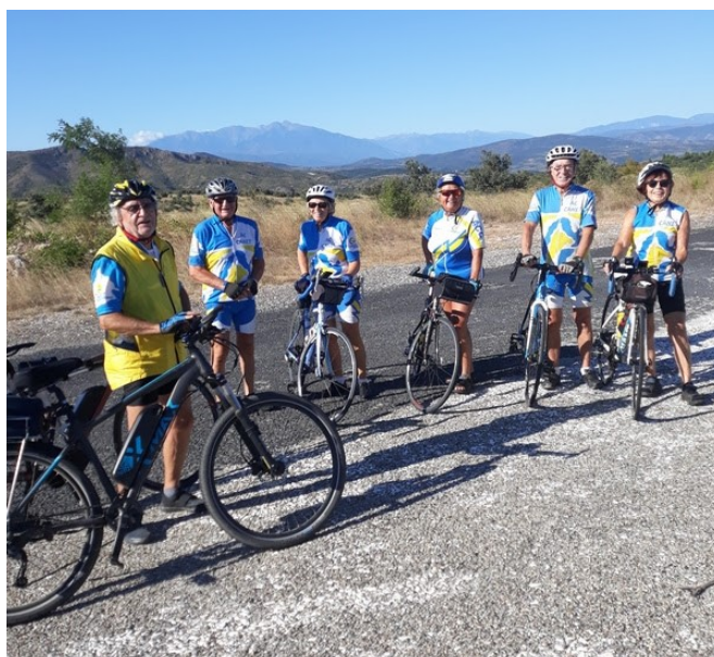
Les 6 participants à la première randonnée VAE